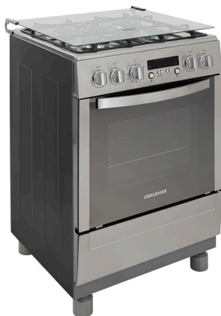
Dimensiones del producto