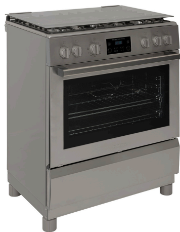
Dimensiones del producto